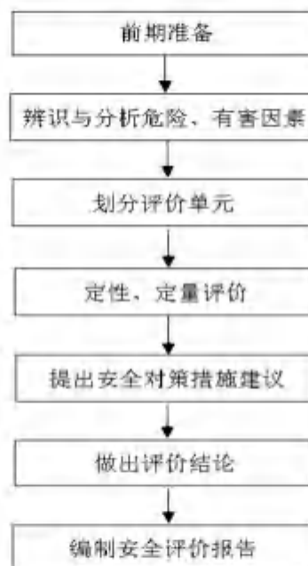
图 1-1 安全评价工作程序图