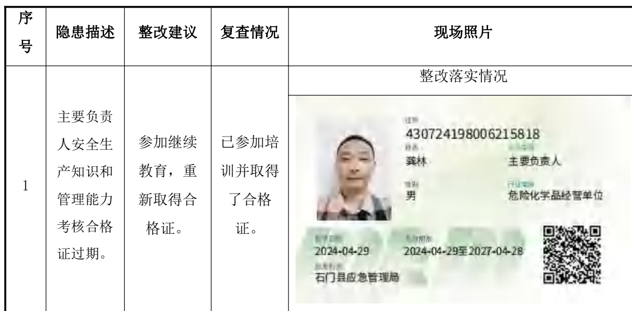
表6-1隐患整改建议及复查情况