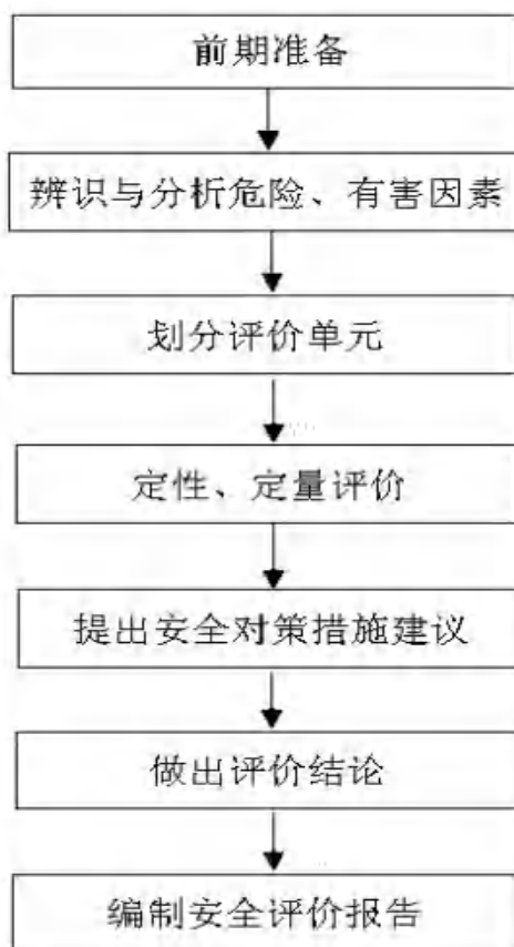
图 1-1 安全评价工作程序图